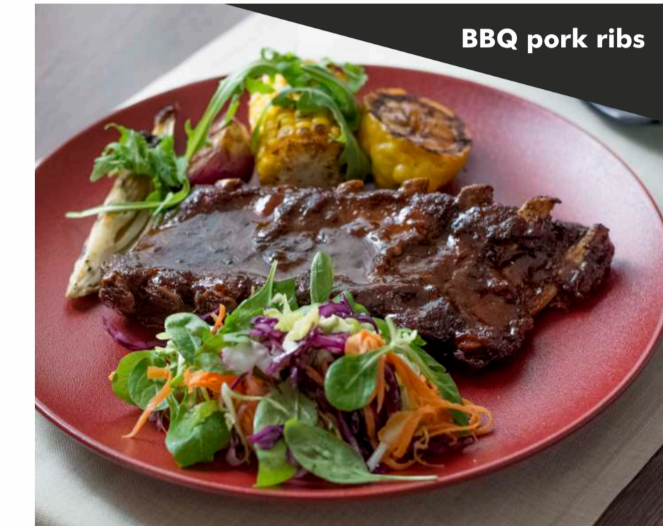
BBQ pork ribs