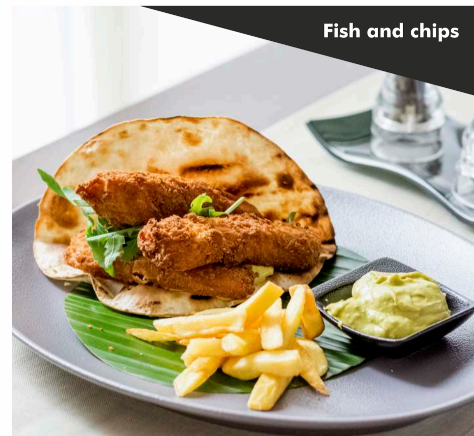
Fish and chips